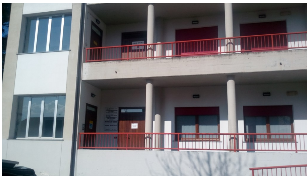
Foto La sede intercamerale di Dubino

In allegato sono riportate le tabelle riepilogative dei principali parametri di attività del Registro Imprese e della sede di Nuova Olonio.